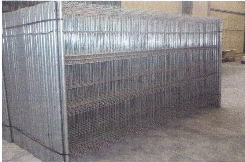
VALLA MOVIL DE LIMITACIÓN